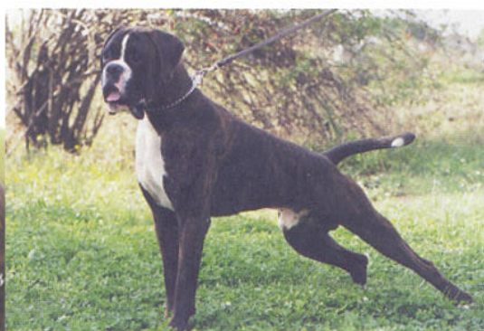
Ch. Leonardo di Casa Bartolini