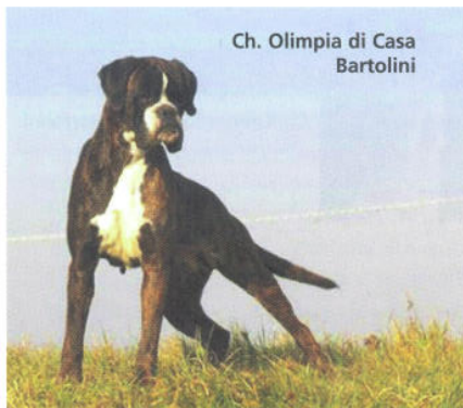
Ch. Olimpia di Casa Bartolini

pesante. Per ottenere dei buoni risultati si deve mantenere il volume totale originario del cranio e cercare di selezionare delle orecchie non eccessivamente ampie ma sufficientemente pesanti per essere ben portate.