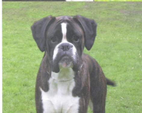
Ch. Denver di Casa Bartolini