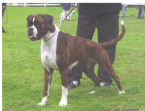
Mascia di Casa Bartolini

Le teste inscatolate, che ben si sposano con le orecchie amputate, perdono in parte di valore e lasciano il posto a crani che lateralmente appaiono leggermente più convessi.